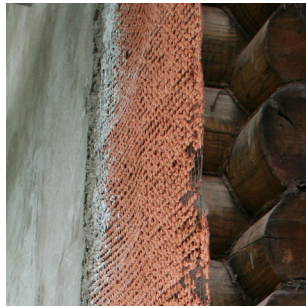
Mischmauerwerk rissfrei verputzen