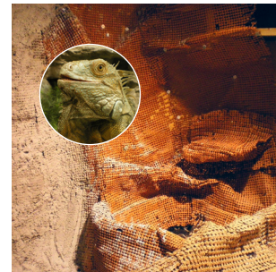
Stauss® Terrarium, ...