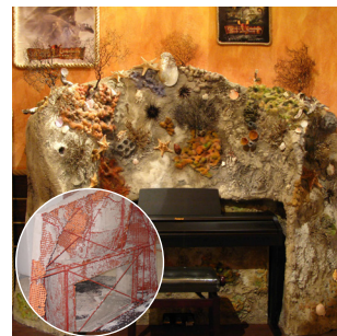
Stauss® kreativer Innenausbau