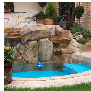
Stauss® Kunstfelsen, Brunnen, ...

Lassen Sie Ihrer KREATIVITÄT freien Lauf!