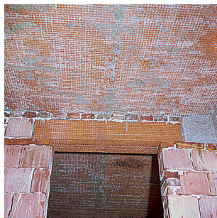
Verkleiden Stahlträger, Holzbalken,..