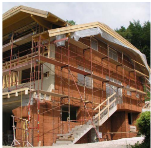
Stauss® Neubau Thermo Fassade