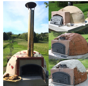
Stauss® Backofen, Grillen, ...