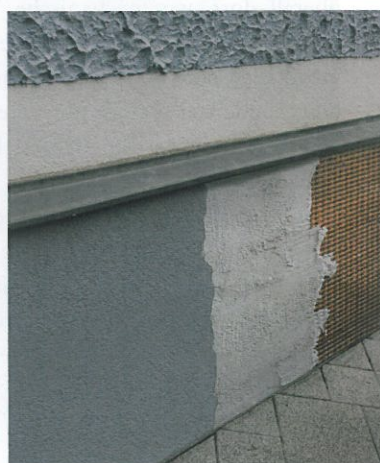
VORHER – NACHHER. Sockelsanierung mit Ziegelgewebe als Putzträger